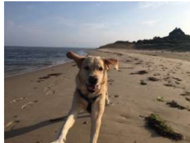
Fynni auf der Nordseeinsel Sylt