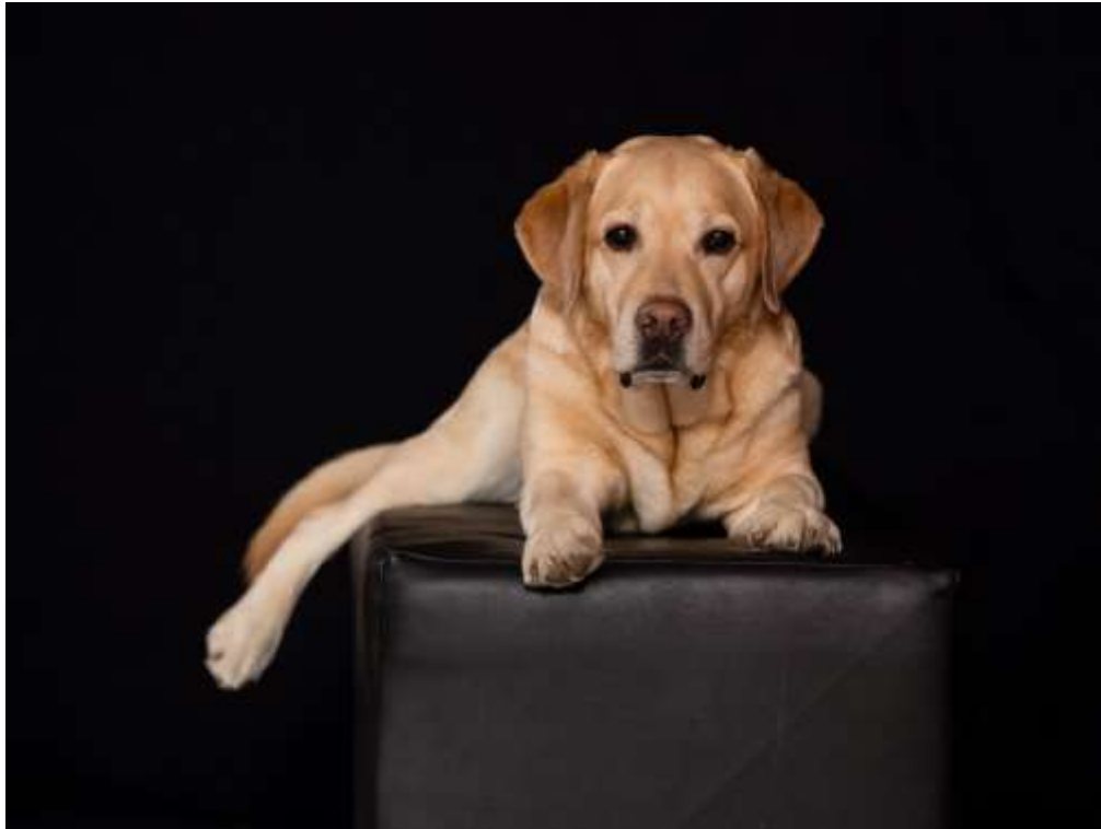
Unser grosser Goldschatz beim Foto-Shooting